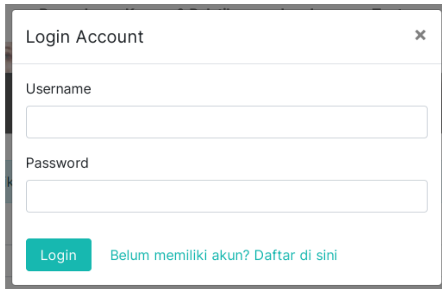
Gambar 1. Tampilan login sistem.

Setelah anda berhasil melakukan pendaftaran, anda dapat melakukan login melalui menu Login yang terdapat pada bagian kanan atas menu utama. Isikan username dan password yang terdaftar. Jika anda belum mempunyai akun, anda diminta untuk melakukan pendaftaran pada menu pendaftaran atau link yang tersedia pada tampilan login. Tampilan halaman login dapat dilihat seperti pada Gambar 1.