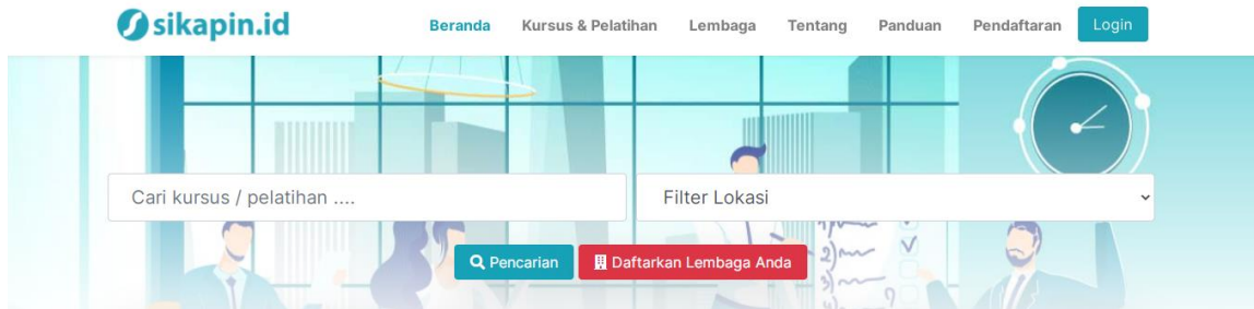
Gambar 2. Tampilan Halaman Pencarian Kursus/Pelatihan

Pencarian kursus/pelatihan dapat dilakukan dengan memasukkan kata kunci pada kolom pencarian serta filter lokasi sesuai dengan keinginan anda. Pencarian dapat dilakukan pada menu Beranda atau menu Kursus & Pelatihan . Tampilan pencarian kursus dapat dilihat seperti pada Gambar 2.